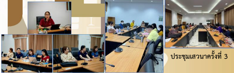
ประชุมเสวนาครั้งที่ 1

เพื่อสร้างกระบวนการบริหารงานรับงานนอกเพื่อการมีรายได้ กระบวนการดำเนินงาน