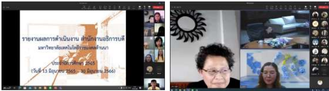
ผู้อำนวยการนำเสนอผลการดำเนินงาน ผ่านระบบ Microsoft TEAMS