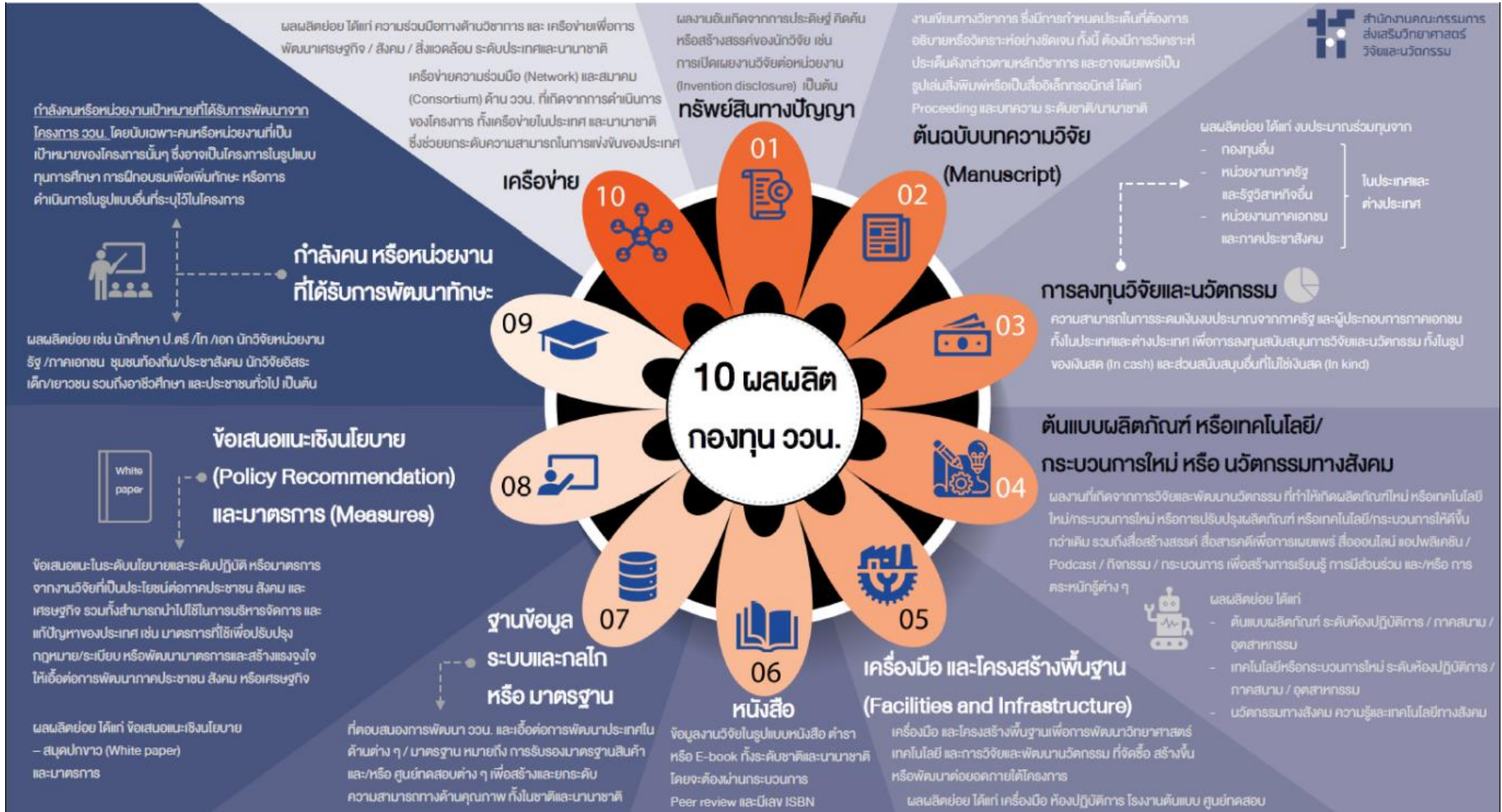
รูปที่ 2 ประเภทและนิยามผลผลิต