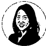
พศ.ดร.อภิญญา บันทิตวุฒิสกุล