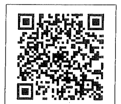
QR-Code เพื่อสอบถามข้อมูล