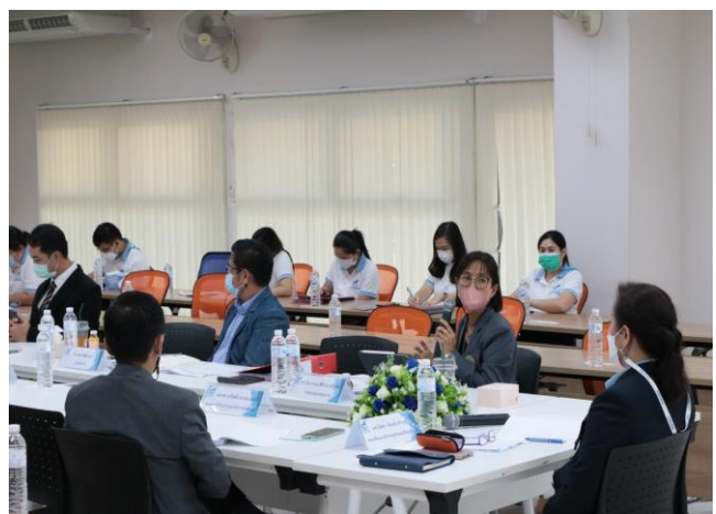
คณะกรรมการประเมินฯ นำเสนอผลการประเมิน