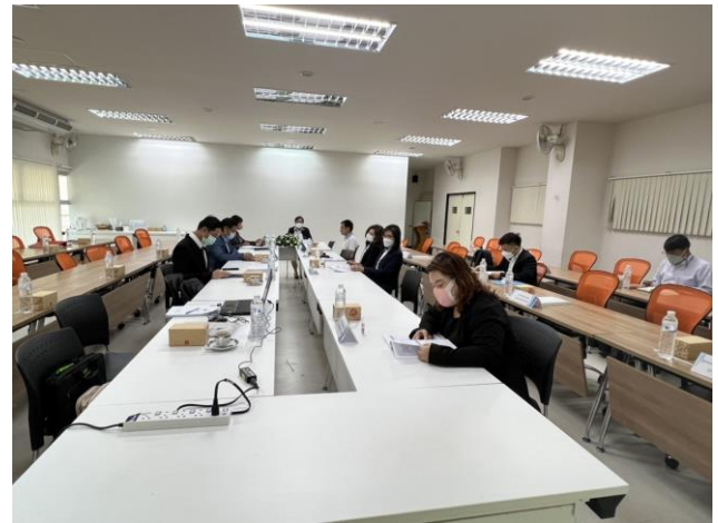
ประธานประเมินฯ ชี้แจงวัตถุประสงค์การประเมินฯ