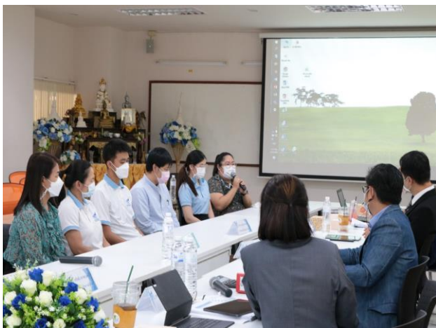
สัมภาษณ์ตัวแทนสายสนับสนุน