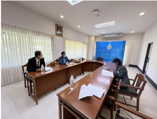
คณะกรรมการฯ ประชุมเตรียมความพร้อม