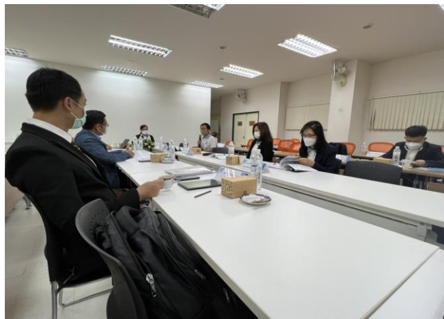
สัมภาษณ์ผู้บริหารคณะ