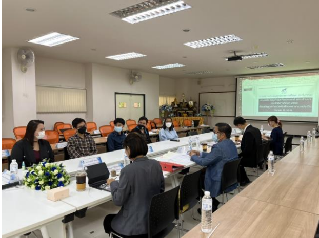
สัมภาษณ์ตัวแทนอาจารย์