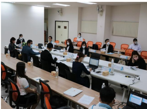
คณะกรรมการฯ ศึกษารายงานการประเมินตนเอง หลักฐานอ้างอิงและสอบถามจากผู้เกี่ยวข้อง