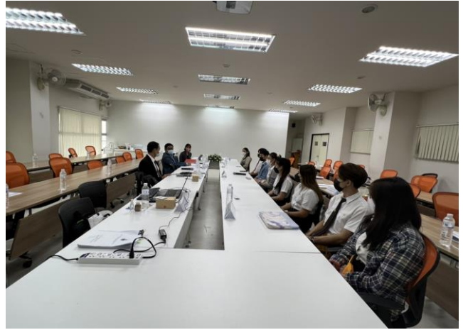
สัมภาษณ์ตัวแทนนักศึกษา