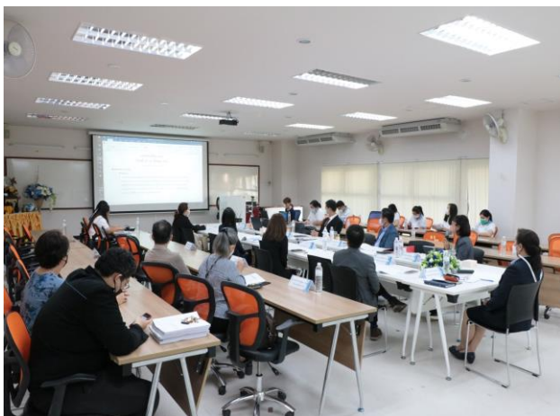
คณะกรรมการประเมินฯ นำเสนอผลการประเมิน