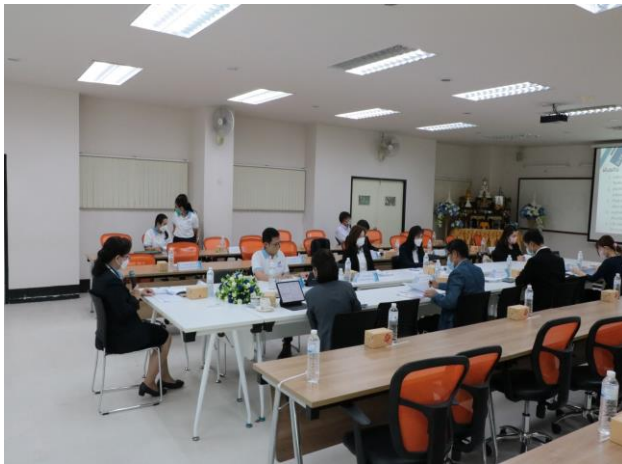
คนบต้นำเสนอผลการดำเนินงาน