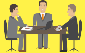
สถานประกอบการ