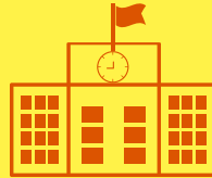
วิทยาลัยฯ