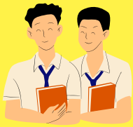
นักศึกษา