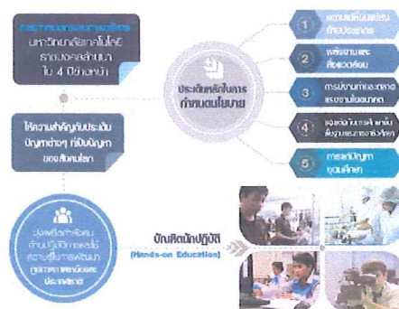
รูปที่ ๓ คุณลักษณะ บัณฑิตนักปฏิบัติของมหาวิทยาลัยเทคโนโลยีราชมงคลล้านนา

เอกลักษณ์มหาวิทยาลัยเทคโนโลยีราชมงคลล้านนา เรามีความถนัดและความสามารถด้าน เทคโนโลยีอุตสาหกรรมขั้นสูง เกษตรอุตสาหกรรม เกษตรปลอดภัย ความหลากหลายทางชีวภาพ ความมั่นคงทางนวัตกรรม เกษตร อาหารล้านนา เทคโนโลยีและการจัดการเพื่อชุมชน โครงข่ายคมนาคมขนส่ง และระบบโลจิสติกส์ การค้าขายแดนและบริการจัดการเทคโนโลยี วัฒนธรรมท้องถิ่นและนวัตกรรม อาหารสุขภาพและพันธุกรรมพืช เป็นกลไกสำคัญในการขับเคลื่อนและสร้างความเข้าใจ ให้มีเป้าหมายเดียวกัน สู่การเป็น “มหาวิทยาลัยนวัตกรรมเพื่อชุมชน”