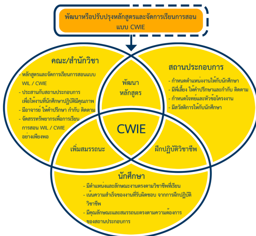
ภาพที่ 2 แสดงกระบวนการเชื่อมโยงดำเนินการจัดการสหกิจศึกษาและการศึกษาเชิงบูรณาการกับการทำงาน

ทั้งนี้การดำเนินการขับเคลื่อนดังกล่าวได้ประสานความร่วมมือกับหน่วยงานภายในและหน่วยงานภายนอก ในการร่วมกันพัฒนาหลักสูตร และจัดการเรียนการสอนในรูปแบบ CWIE เพิ่มศักยภาพฝึกปฏิบัติวิชาชีพ และเพิ่มสมรรถนะการทำงานสู่อนาคต ตรงตามความต้องการของสถานประกอบการ รายละเอียดดังภาพประกอบ