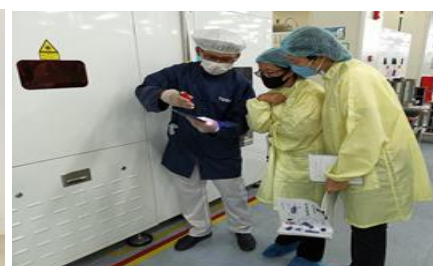
ภาพที่ 3 แสดงการฝึกปฏิบัติ/ฝึกประสบการณ์วิชาชีพและการนิเทศในสถานประกอบการ