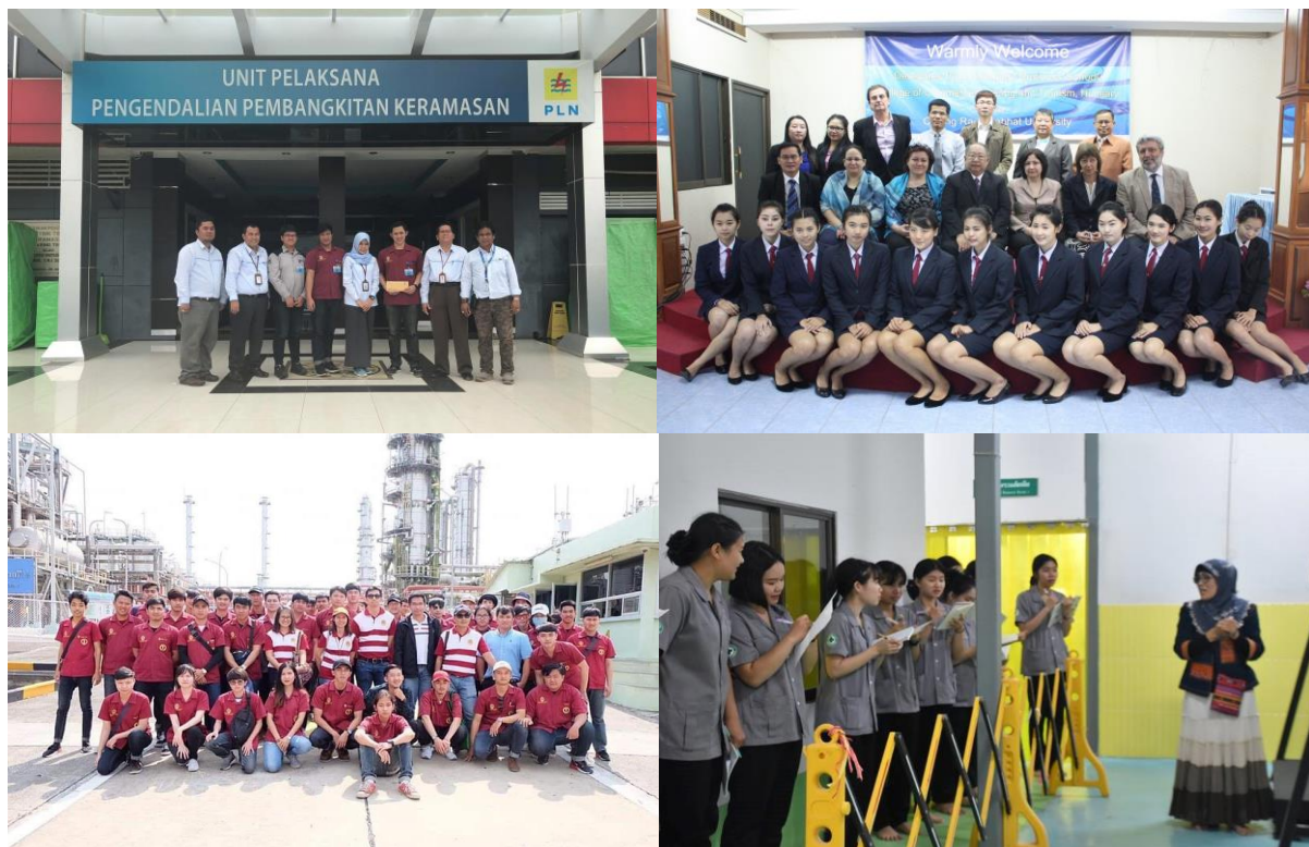
ภาพที่ 9 แสดงการฝึกปฏิบัติของนักศึกษาในสถานประกอบการทั้งในประเทศและต่างประเทศ

นอกจากนี้มหาวิทยาลัยยังได้สนับสนุนงบประมาณให้นักศึกษาที่ผ่านการคัดเลือกเข้ารับการฝึกปฏิบัติสหกิจศึกษา ในสถานประกอบการในต่างประเทศ ได้แก่ ค่าเดินทาง ค่าครองชีพ รวมถึงได้มอบประกาศเกียรติคุณดีเด่นให้กับนักศึกษาเพื่อเป็นขวัญกำลังใจและแรงบันดาลใจของนักศึกษา และจากผลการดำเนินงานดังกล่าวส่งผลให้มหาวิทยาลัยมีจำนวนสถานประกอบการในต่างประเทศเพิ่มมากขึ้นในหลากหลายประเทศ เช่น สาธารณรัฐประชาชนจีน สาธารณรัฐเกาหลี สาธารณรัฐฟิลิปปินส์ สาธารณรัฐอิตาลี สหพันธ์สาธารณรัฐประชาธิปไตยเนปาล สาธารณรัฐอินเดีย สหพันธ์สาธารณรัฐเยอรมนี สาธารณรัฐประชาธิปไตยประชาชนลาว เครือรัฐออสเตรเลีย สาธารณรัฐอินโดนีเซีย ญี่ปุ่น สหรัฐอเมริกา ไต้หวัน มาเลเซีย และออสเตรเลีย เป็นต้น