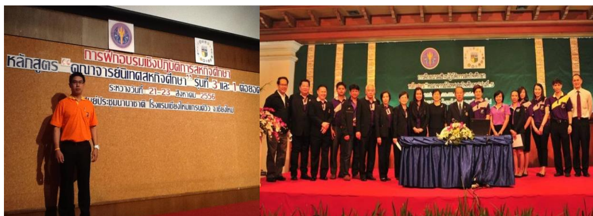
ภาพที่ 4 แสดงการเข้าร่วมอบรมเชิงปฏิบัติการสหกิจศึกษาของบุคลากรมหาวิทยาลัยราชภัฏเชียงราย