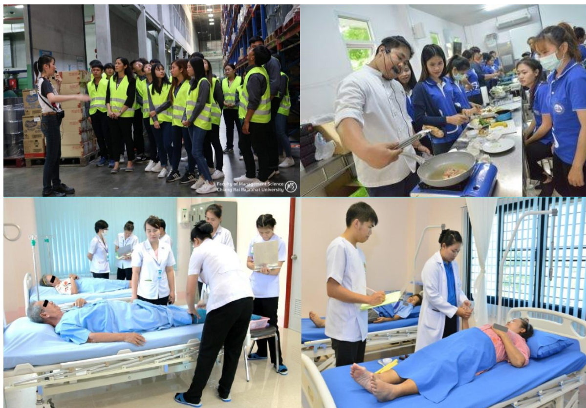
ภาพที่ 5 แสดงการฝึกปฏิบัติจริงในสถานประกอบการของนักศึกษา

จากข้อมูลดังกล่าวข้างต้น จะเห็นได้ว่าผลการประเมินนักศึกษาที่ผ่านกระบวนการบูรณาการเรียนการสอนกับการทำงาน (Work Integrated Learning : WIL) ทั้ง 3 ปี มีผลคะแนนเป็นที่น่าพอใจ แต่คะแนนขึ้นอยู่กับความสามารถและทักษะของนักศึกษาแต่ละรุ่น โดยคณะ/สำนักวิชาจะนำเอาผลการประเมินดังกล่าวมาจัดกิจกรรมเสริมหลักสูตร และการเรียนการสอนที่เหมาะสมและเป็นประโยชน์ต่อนักศึกษาให้มากที่สุดต่อไป