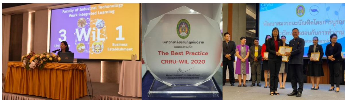
ภาพที่ 7 แสดงการประกวดผลการดำเนินงานภายใต้กิจกรรม “The Best Practice CRRU-WIL”

3.5 มีการกำกับ ติดตาม ผลการดำเนินงานพัฒนาสมรรถนะบัณฑิตเพื่อตอบสนองการพัฒนาประเทศ 4.0 โดยการให้คณะ/สำนักวิชา นำเสนอประกวดผลการดำเนินงานภายใต้กิจกรรม “The Best Practice CRRU-WIL” และจัดทำรายงาน เพื่อสรุปผล กิจกรรมจัดสหกิจศึกษาและการศึกษาเชิงบูรณาการกับการทำงาน ระดับคณะ/วิทยาลัยประจำปี งบประมาณ 2563 และเชิญเกียรติหน่วยงานจัดการศึกษา มหาวิทยาลัยราชภัฏเชียงราย ในการร่วมขับเคลื่อนยุทธศาสตร์ CRRU-WIL อีกทั้งยังเป็นการเผยแพร่องค์ความรู้ กระบวนการ รูปแบบการจัดการเรียนการสอนบูรณาการกับการทำงาน ระหว่างหน่วยงานจัดการศึกษาภายในมหาวิทยาลัย ซึ่งเป็นการแลกเปลี่ยนเรียนรู้ร่วมกัน และสามารถนำไปปรับกระบวนการของแต่ละคณะให้เกิดประสิทธิภาพการดำเนินงานการจัดการเรียนการสอนรูปแบบ WIL ในคณะ/สำนักวิชา