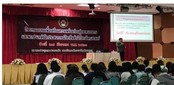
ภาพที่ 1 แสดงการแลกเปลี่ยนองค์ความรู้สหกิจศึกษาและการศึกษาเชิงบูรณาการกับการทำงาน