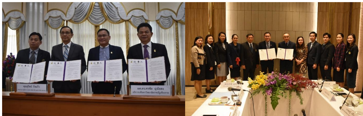
ภาพที่ 8 แสดงการลงนามความร่วมมือทางวิชาการกับสถานประกอบการ

คณะเทคโนโลยีอุตสาหกรรม ลงนามความร่วมมือ (MOU) ระหว่าง สถานประกอบการ M.L.T. Solar Energy Products Co.,Ltd. , บริษัท ป.สยาม ทรานสปอร์ต จำกัด , บริษัท Thai Excel Foods Co.,Ltd. , บริษัท JWD แปซิฟิกห้องเย็น เติร์มความพร้อม เพื่อให้นักศึกษาฝึกปฏิบัติในทุกๆ กระบวนการ ตลอด 1 ปีการศึกษา และพร้อมรับเข้าทำงานหลังกระบวนการฝึกปฏิบัติงานจริง