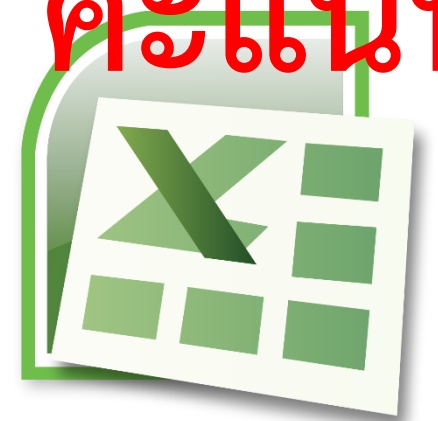
หลักสูตร โปรแกรมตารางคำนวณ

จำนวนแบบทดสอบทั้งสิ้น 60 ข้อ ใช้เวลาในการทดสอบ 60 นาที