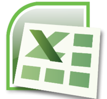
หลักสูตรโปรแกรมตารางคำนวณ