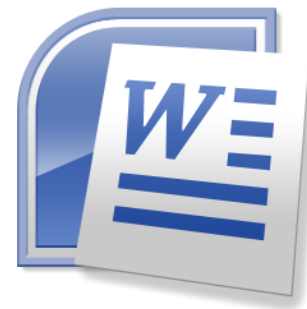
หลักสูตรโปรแกรมประมวลผลคำ