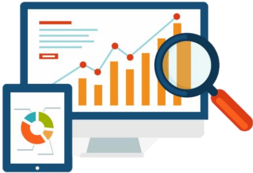
หลักสูตรคอมพิวเตอร์พื้นฐาน