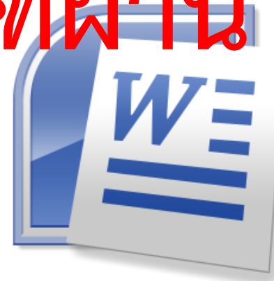
หลักสูตร โปรแกรมประมวลผลคำ