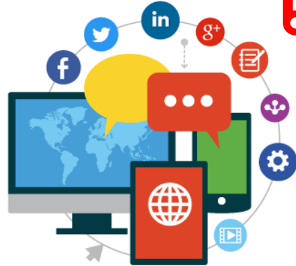
หลักสูตรการใช้งานโปรแกรมออนไลน์