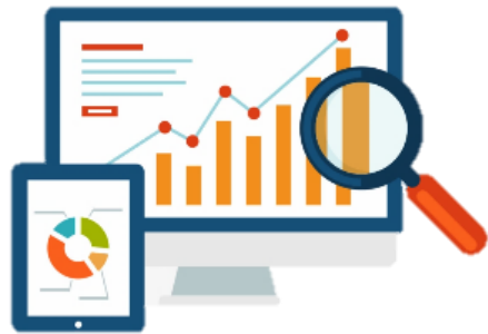
หลักสูตรคอมพิวเตอร์พื้นฐาน