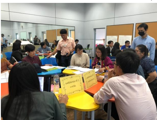
คณะกรรมการประเมินคุณภาพ ศึกษาเอกสาร หลักฐาน