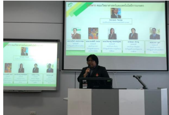
รองคณบดีนำเสนอผลการดำเนินงาน