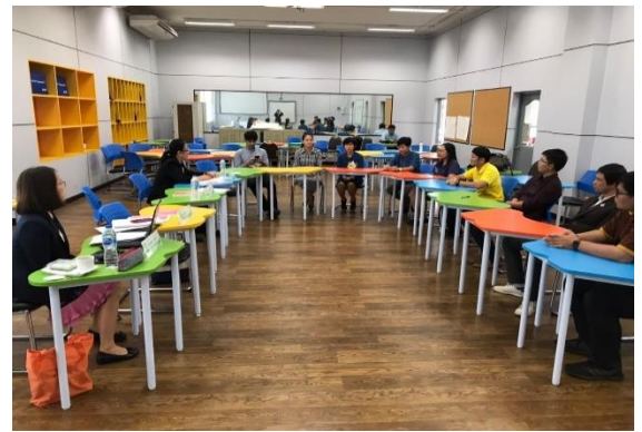
สัมภาษณ์ตัวแทนอาจารย์