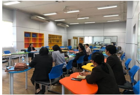
สัมภาษณ์ผู้บริหาร