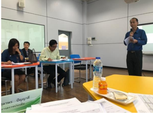
คนบดักกล่าวต้อนรับคณะกรรมการประเมิน