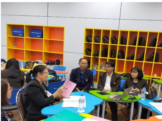
คณะกรรมการประเมินคุณภาพ ศึกษาเอกสาร หลักฐาน