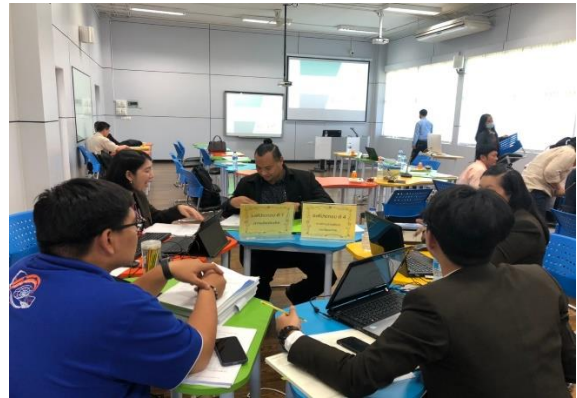
คณะกรรมการประเมินคุณภาพ ศึกษาเอกสาร หลักฐาน