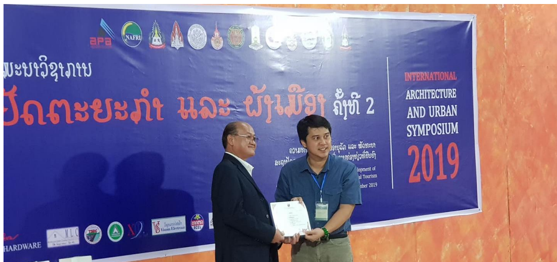
รับมอบใบประกาศนียบัตร