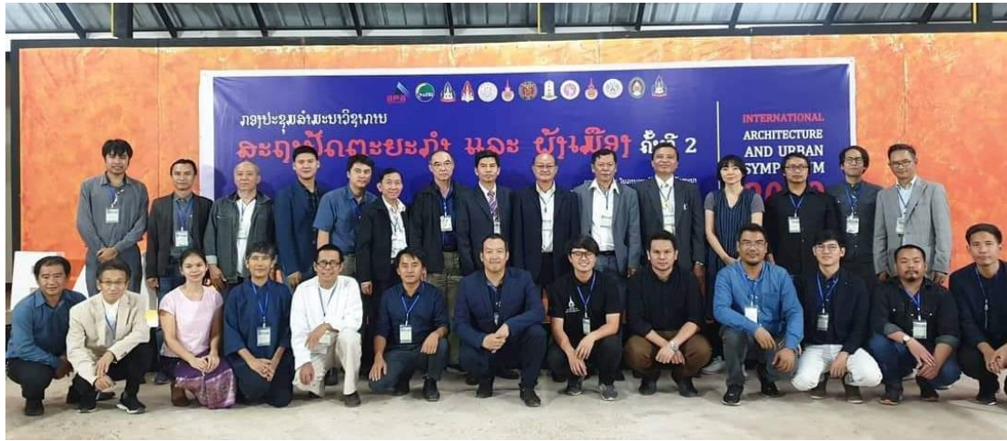
ผู้เข้าร่วมนำเสนอบทความ