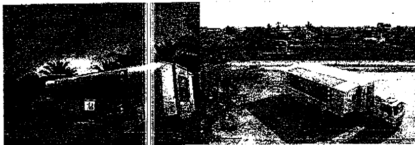
ประตูทางเข้าและออก

รอบฉาย เวลา ๑๖.๐๐ น. เป็นต้นไป (บุคคลทั่วไป/นักศึกษา)