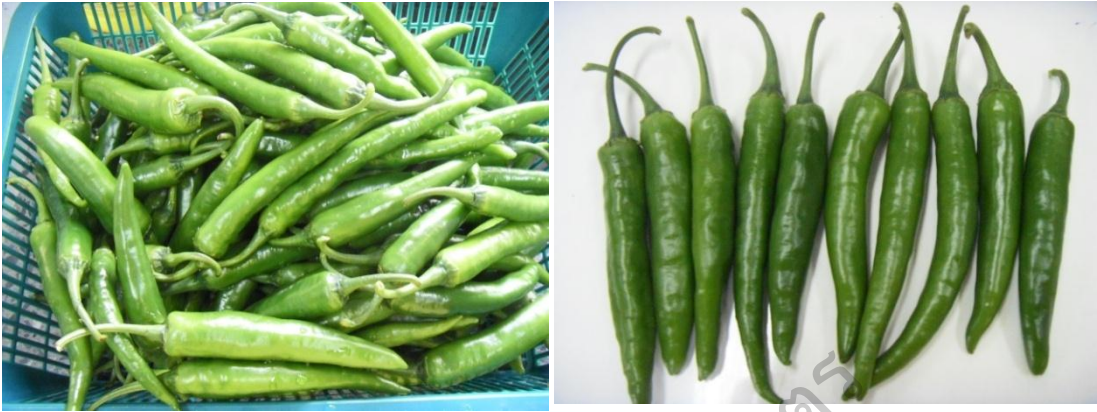
รูปผนวกที่ 2 ผลพริกที่ใช้ในการทดสอบในห้องปฏิบัติการ