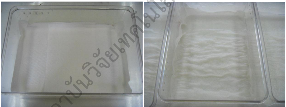
รูปผนวกที่ 3 กล่องบ่มผลพริกที่มีกระดาษทิชชูที่มีความชื้น