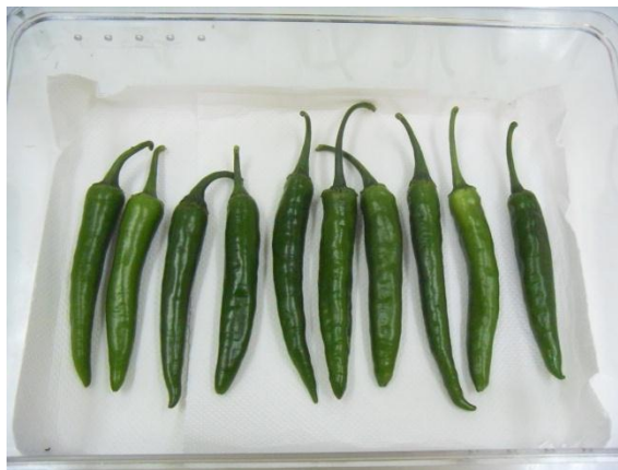
รูปผนวกที่ 4 การจัดวางผลพริก